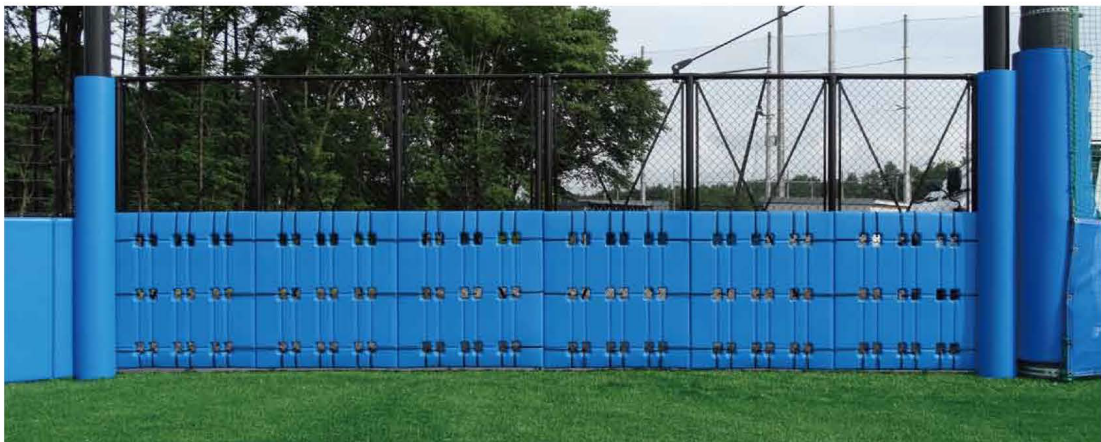
宇都宮市内某私立高校野球場