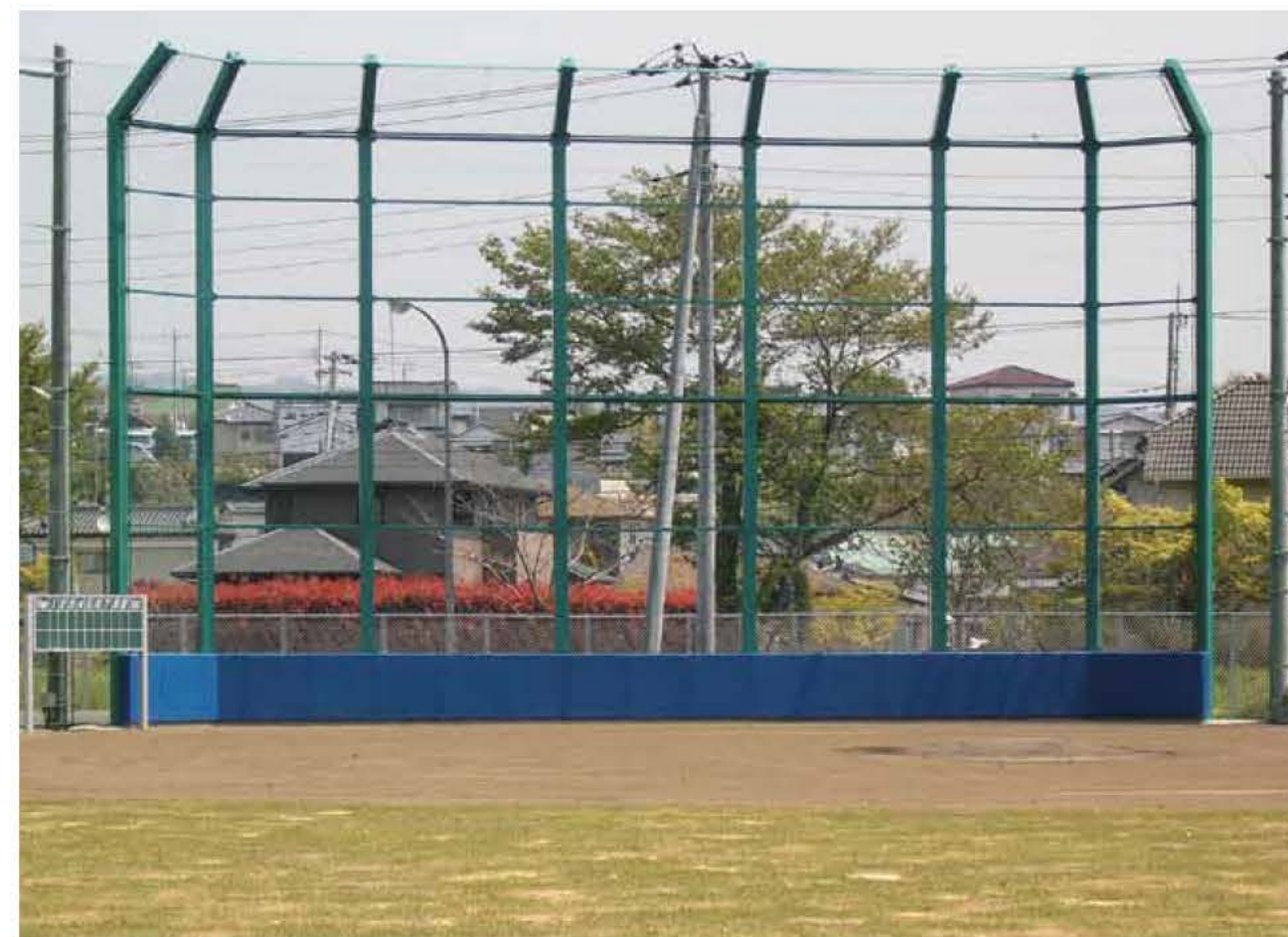
茨城県内某野球場