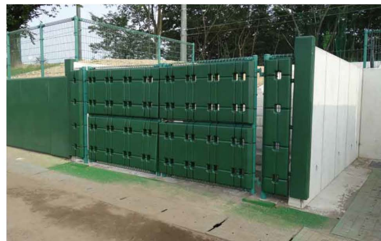
愛知県半田市内某野球場