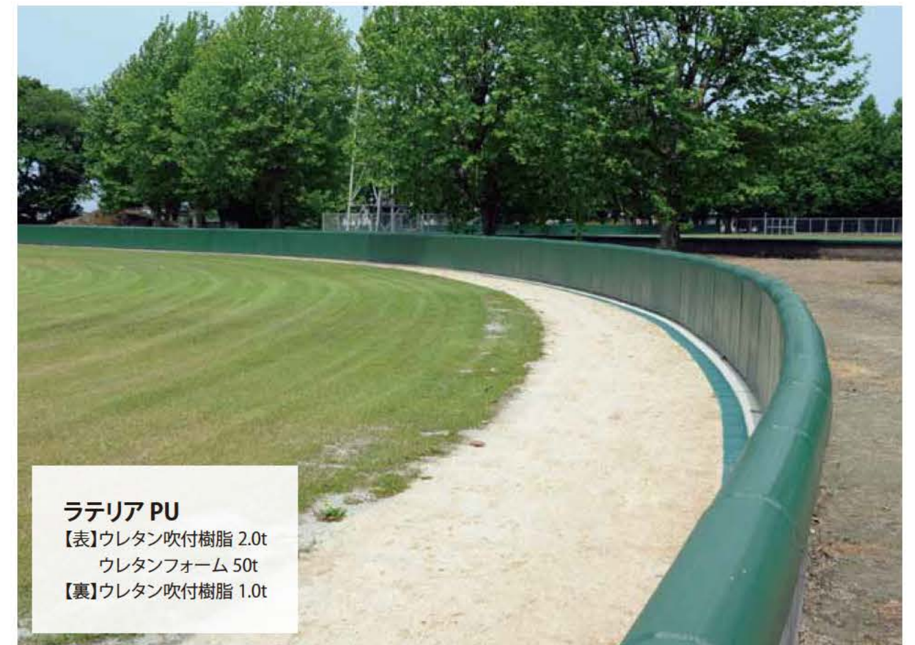
ラテリア PU 【表】ウレタン吹付樹脂 2.0t ウレタンフォーム 50t 【裏】ウレタン吹付樹脂 1.0t