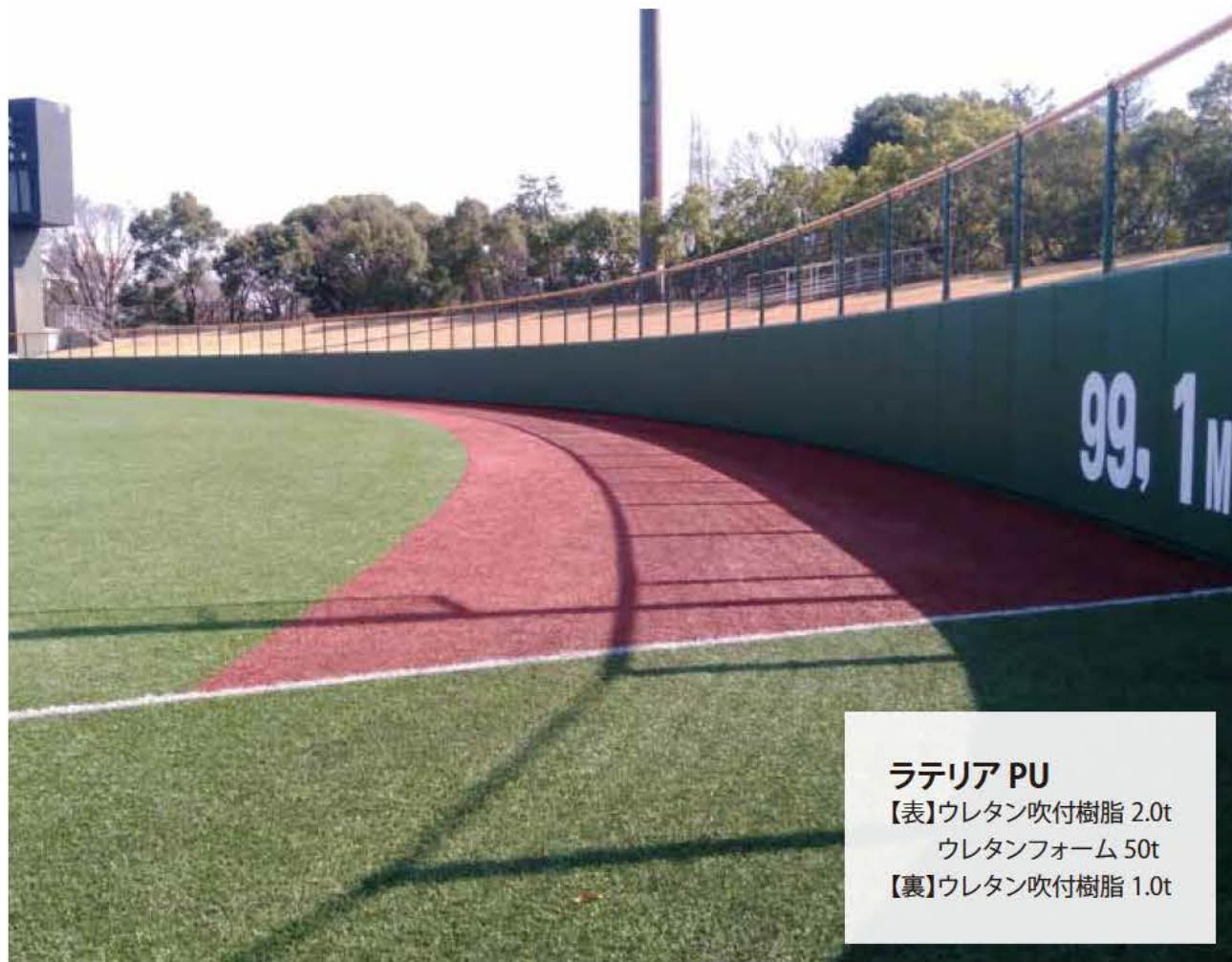
ラテリア PU 【表】ウレタン吹付樹脂 2.0t ウレタンフォーム 50t 【裏】ウレタン吹付樹脂 1.0t