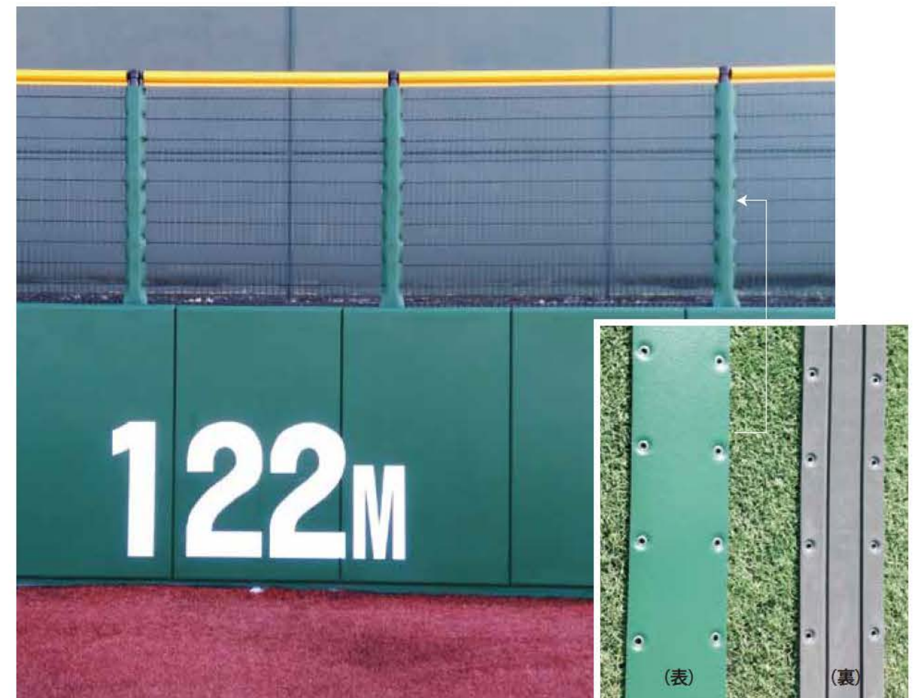
名古屋市内某野球場