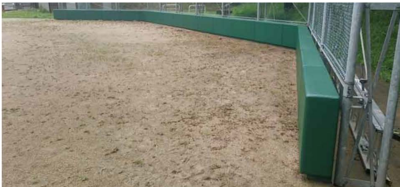
新潟県糸魚川市内某総合グラウンド