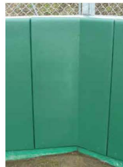
新潟県糸魚川市内某総合グラウンド