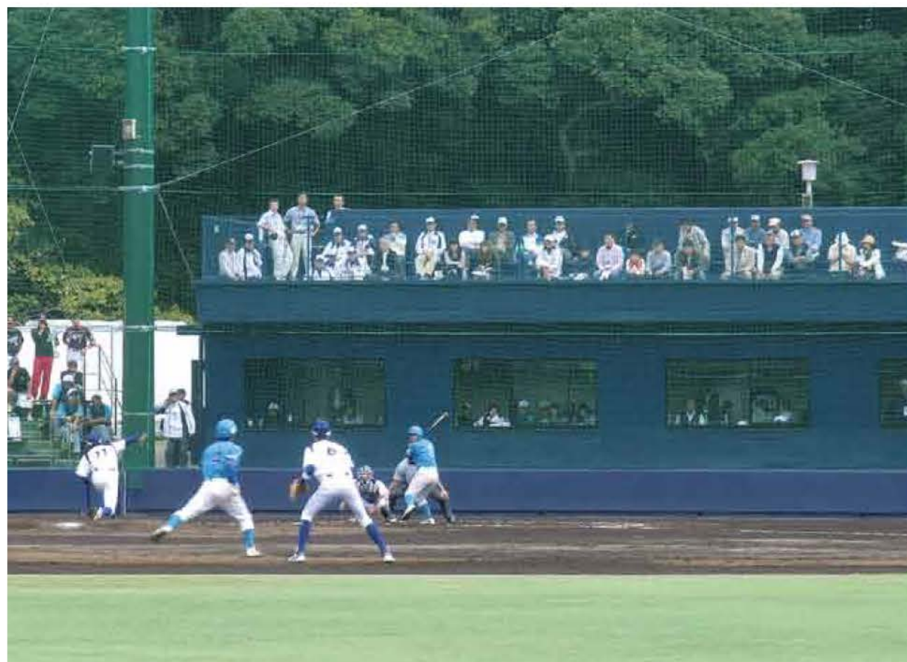
千葉県内某野球場

【表】ウレタン吹付樹脂 2.0t ウレタンフォーム 50t 【裏】ウレタン吹付樹脂 1.0t