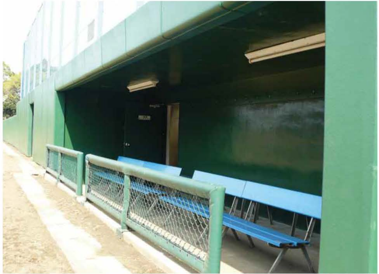
千葉県内某野球場