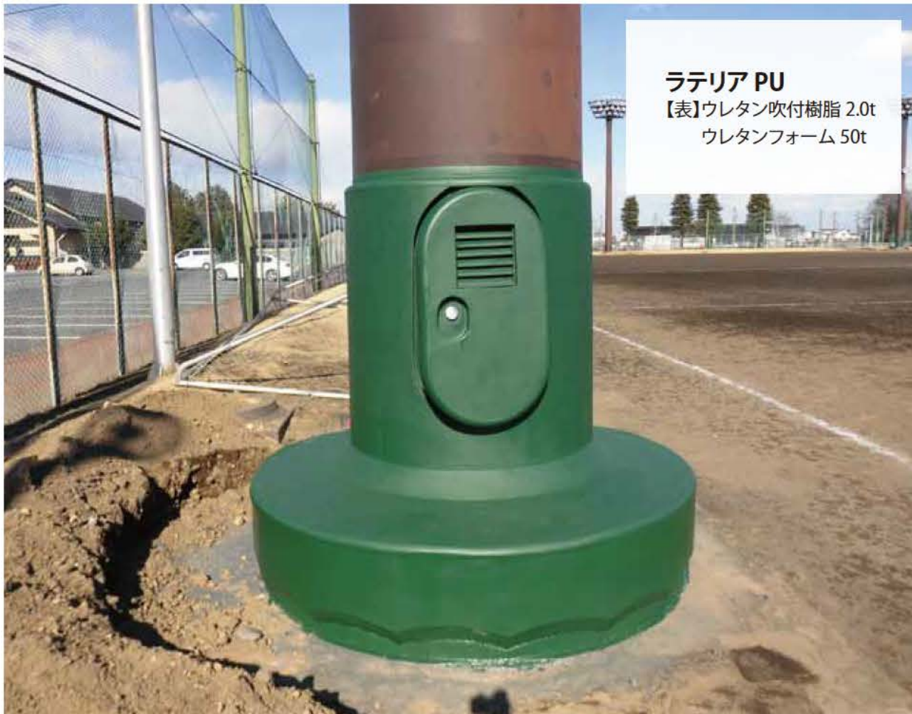
ラテリア PU 【表】ウレタン吹付樹脂 2.0t ウレタンフォーム 50t